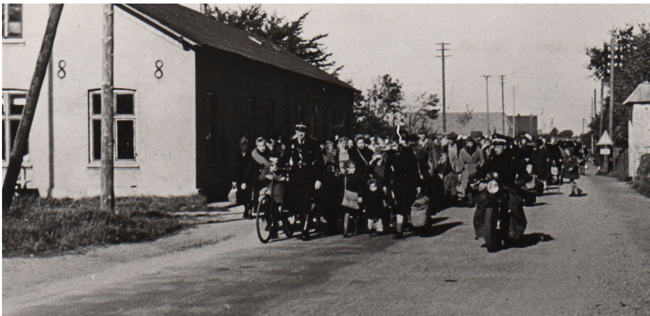
Tyske flygtninge kommer til Danmark i begyndelsen af 1945

på at komme i sikkerhed søgte en del af flygtningestrømmen mod vest med jernbane, til vogns eller til fods. Andre søgte fra de belejrede Østersøbyer mod kysten, hvor den tyske marine havde indledt en stor evakuering. Flygtningeskibene var fyldt til bristepunktet og var under stadig trussel fra russiske ubåde. Redningsaktionen blev ramt af flere af verdenshistoriens største skibskatastrofer. Alene sænkningerne af skibene 'Wilhelm Gustloff', 'van Steuben' og 'Goya' krævede omkring 20.000 ofre.