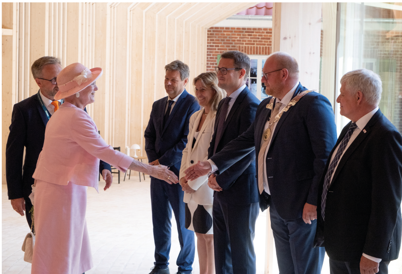
Hendes Majestæt Dronning Margrethe den anden, indvier FLUGT den 25/6 2022