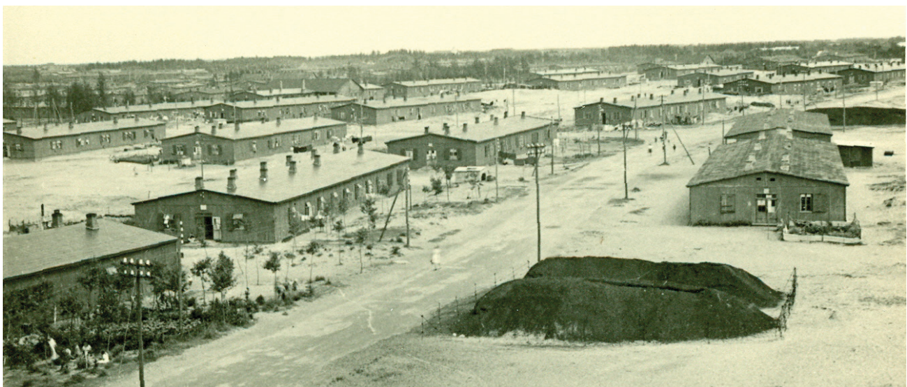
Flygtningelejren i Oksbøl bestod af flere hundrede barakker, hvor de op mod 36.000 personer blev indkvarteret. Hver barak husede cirka 150 personer. Også lejrens tidligere hestestalde blev taget i anvendelse til beboelse. Her blev der skabt 'skillevægge' mellem familier ved hjælp af tæpper. Livet i boligerne er blevet beskrevet som fuldt af støj, os, lugte og rod. Om vinteren var det svært at varme barakkerne op.

Indkvarteringen i Oksbøllejren fandt sted i alle de godt 200 mandskabsbarakker, men også de ca. 80 hestestaldsbarakker blev taget i brug til beboelse. Lejren måtte desuden udvides for at skaffe pladser nok, og ved årsskiftet 1945-46 var der skabt plads til yderligere 20.000 flygtninge. Indbyggertallet kom derved op på 35.000 personer. Det betød, at lejren var den sjette største 'by' i Danmark. En storby bag pigtråd, er den blevet kaldt.